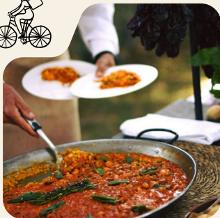
COCINERO A DOMICILIO