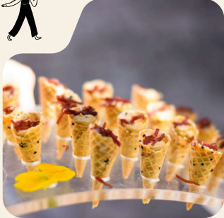
BANQUETE Ó COCTEL