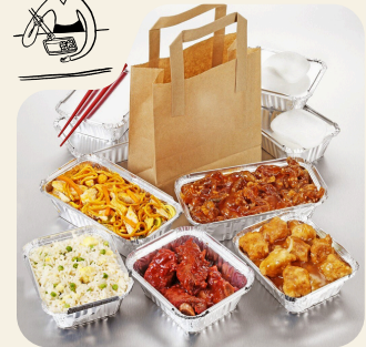
COMIDA PARA LLEVAR