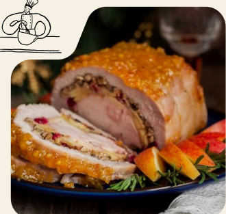
MENÚ DE NAVIDAD